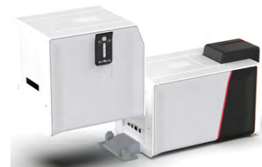
Instalación en un paso y conexión a través de infrarrojos