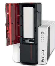
Opción de cargador de 200 tarjetas