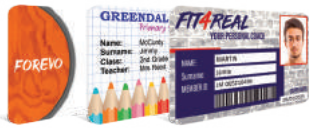
Biblioteca de plantillas en línea