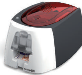
Impresora de tarjetas identificativas Badgy