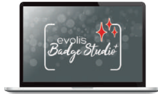
Software de personalización de tarjetas Evolis Badge Studio®