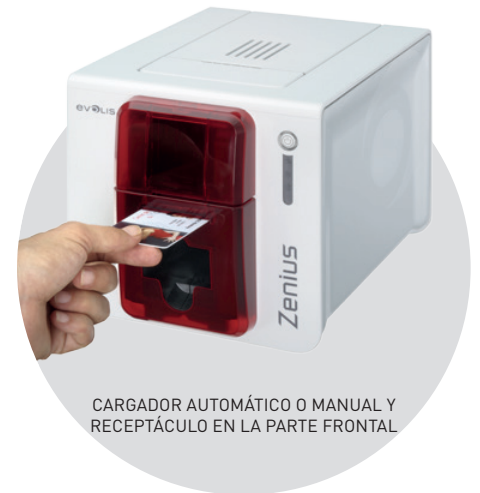
CARGADOR AUTOMÁTICO O MANUAL Y RECEPTÁCULO EN LA PARTE FRONTAL

Manipulación sencilla, reconocimiento y configuración automáticas de la cinta